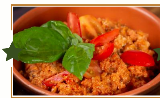
PAPPA AL POMODORO