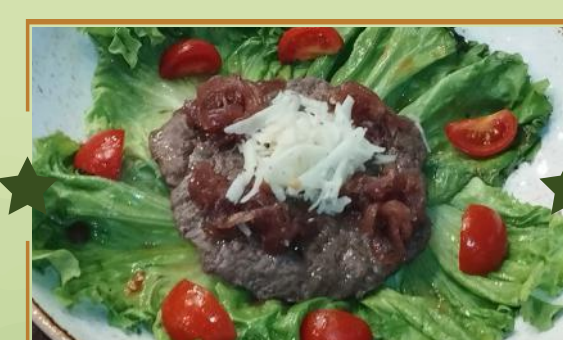
AL PIATTO BUHO PILLONZI

★ BUHO PILLONZI 14,90 Burger Chianina IGP Certificata 150gr, bianchetta al tartufo, insalata, cipolle rosse caramellate*, patate fritte