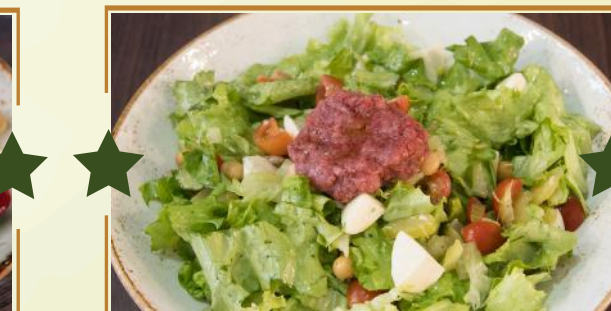
POHÈ CON LA CICCIA

★ POHÈ CON LA CICCIA 11,90 Insalata, pomodorini, crema di panzanella*, mozzarella di bufala, ceci, chianina IGP certificata, schiacciata