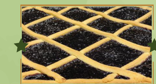
CROSTATATA CON CONFETTURE FIorentINE

★ CANTUCCI DI MAMMA ADRIANA CON VIN SANTO DEL CHIANTI 6,90