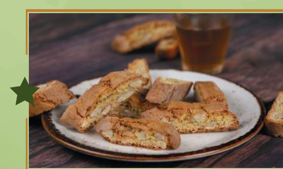
CANTUCCI DI MAMMA TOSCANA