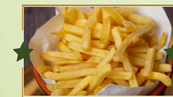
PATATINE FRITTE 3,90