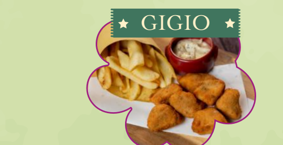
BOCCONCINI DI POLLO FRITTO E PATATINE FRITTE BASTONCINO