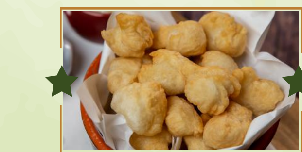
COCCOLI FIorentINI 4,90