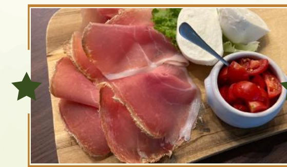
NON CI RESTA CHE PIANGERE

★ MISTO SALUMI & FORMAGGI 13,90 Salame sbriciolona, prosciutto crudo Casentino, caprino, pecorino di Manciano, cipolle rosse caramellate*, schiacciata