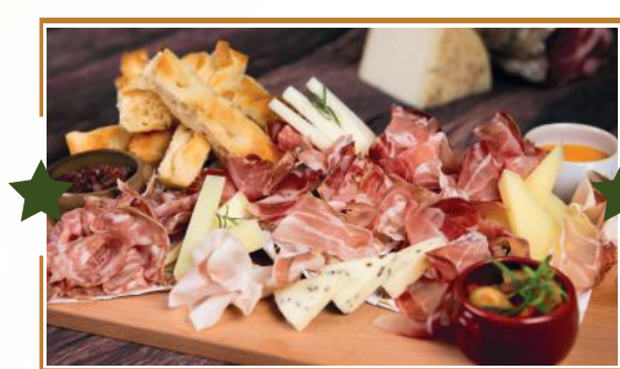
MISTO PER DUE PERSONE