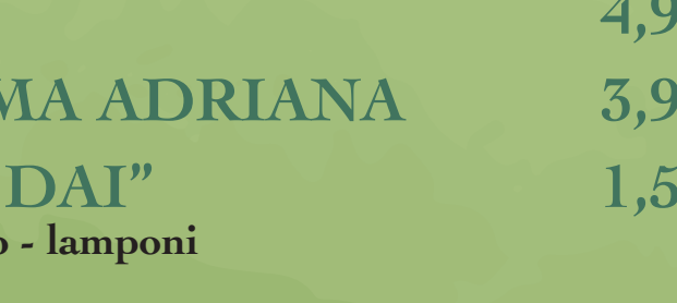
BICCHIERE FRUTTI ROSSI