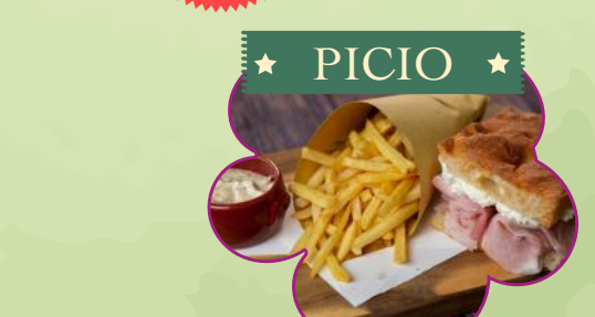
SCHIACCIATA E PATATINE FRITTE BASTONCINO